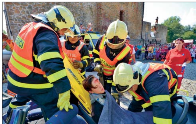
UKÁZKA POSTUPU první pomoci u autonehody.

setkají v Ostravě, aby změřili své síly. Návštěvníkům spolu se svými čtyřnohými svěřenci předvedou dovednosti a umění, jak obstát ve všech náročných situacích, kterým čelí při výkonu služby. Účelem setkání je také výměna cenných zkušeností. Pro širokou veřejnost je tato akce jedinečnou příležitostí seznámit se blíže s prací strážníků a policistů vykonávajících službu v sedlech koní. Strážníci a policisté na koních se utkají ve třech disciplínách – parkúrovém skákání, zrcadlovém skákání a hlavní disciplíně, tzv. policejním parkúru. Návštěvníci se také mohou těšit na bohatý doprovodný program a připraven je rovněž program pro děti. Vstup na akci je bezplatný.